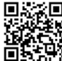
桃園市 111 學年度國民中學 藝術才能音樂班鑑定線上報名系統